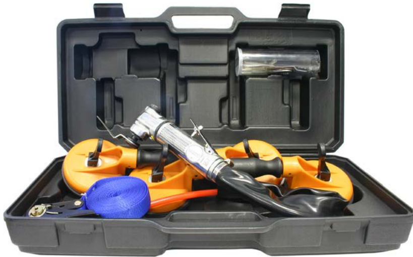
LAR-518K KIT COMPUESTO DE: DESMONTALUNAS 2 VENTOSAS DOBLES 1 CORREA TENSORA CON TRINQUETE 5 CUCHILLAS DESMONTALUNAS: C-1T, C-8T, C-14T, C-17T y C-26T CONECTOR A ENCHUFE RÁPIDO MALETÍN DE PLÁSTICO