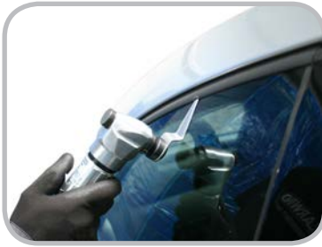
Herramienta indicada para el corte del adhesivo sellador de la lunas