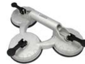
Gama de ventosas industriales disponibles en páginas 280-283