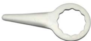
C-17T LONGITUD DE CORTE: 36 mm