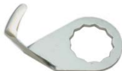
C-8T LONGITUD DE CORTE: 18 mm