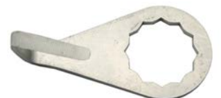
C-9TR LONGITUD DE CORTE: 24 mm