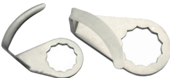
C-10T LONGITUD DE CORTE: 36 mm