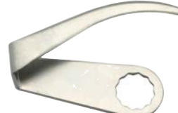
C-13T LONGITUD DE CORTE: 98 mm