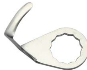
C-9T LONGITUD DE CORTE: 24 mm