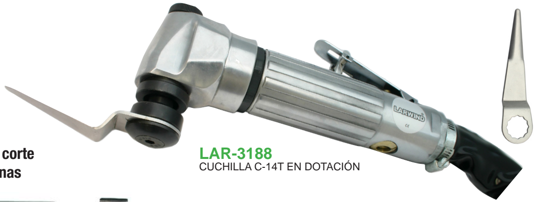
LAR-3188 CUCHILLA C-14T EN DOTACIÓN