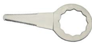
C-17TB LONGITUD DE CORTE: 26 mm